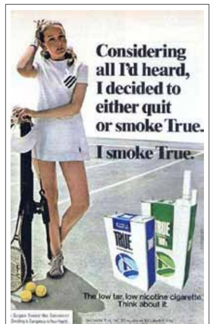
Publicidad que incita a los fumadores a cambiar por los cigarrillos ligeros en vez de dejar de fumar. Título: “Después de pensar en todo lo que he escuchado, decidí que debo dejar de fumar o fumar True. Opté por fumar True. El cigarrillo con bajo contenido de alquitrán y nicotina. Piénsalo.”