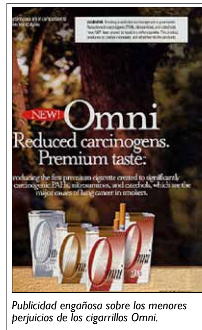
Publicidad engañosa sobre los menores perjuicios de los cigarrillos Omni.