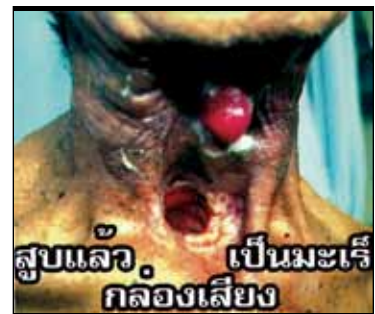
Étiquette de mise en garde, Thaïlande