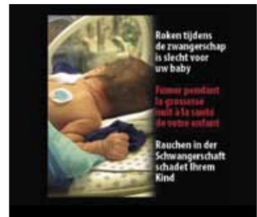
Étiquette de mise en garde, Belgique