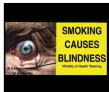
Étiquette de mise en garde, Nouvelle Zélande